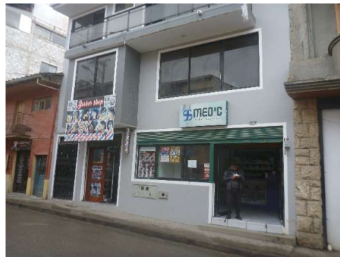
FARMACIA CENTRO CANTONAL