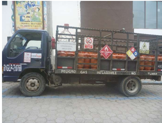
VEHICULO GLP -SIGSIG CENTRO