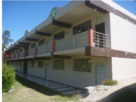
SINDICATO DE CHOFERES SIGSIG