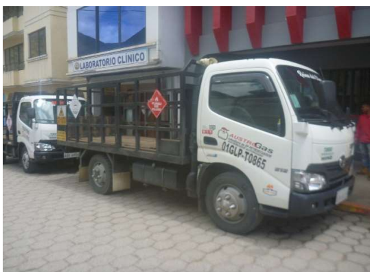
VEHICULO GLP SAN BARTOLOME