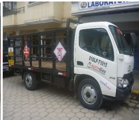
VEHICULO GLP SAN BARTOLOME