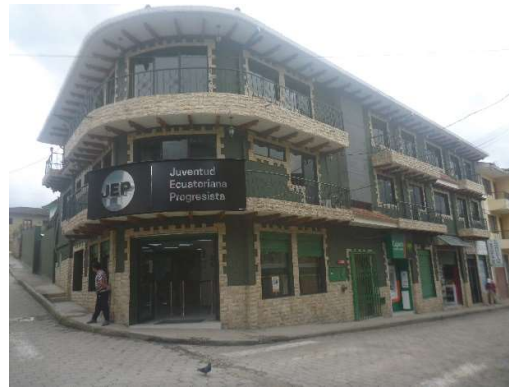
COOPERATIVA JEP SIGSIG CENTRO