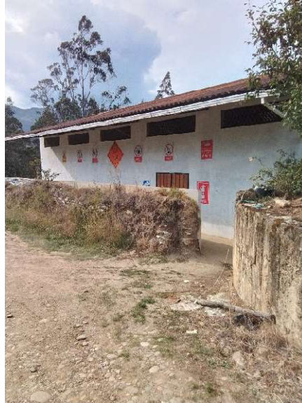
Bodega de Fuegos Pirotécnicos en Cuchil, Zhuzho,