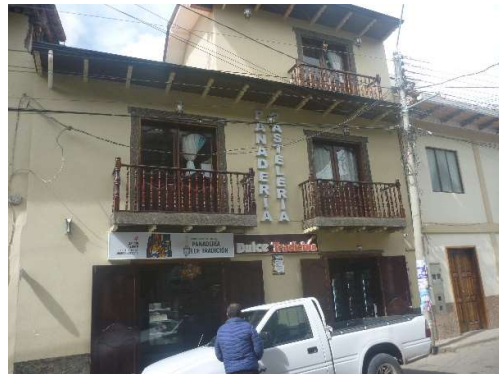
PANADERIA SIGSIG - CENTRO