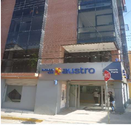
BANCO DEL AUSTRO SIGSIG