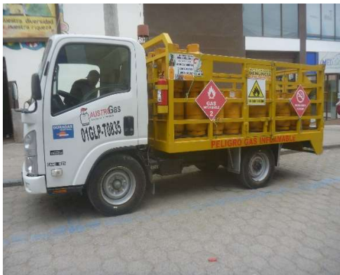
VEHICULO GLP SAN BARTOLOME