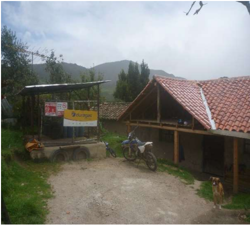
DEPOSITO GLP ZHAMAR – JIMA