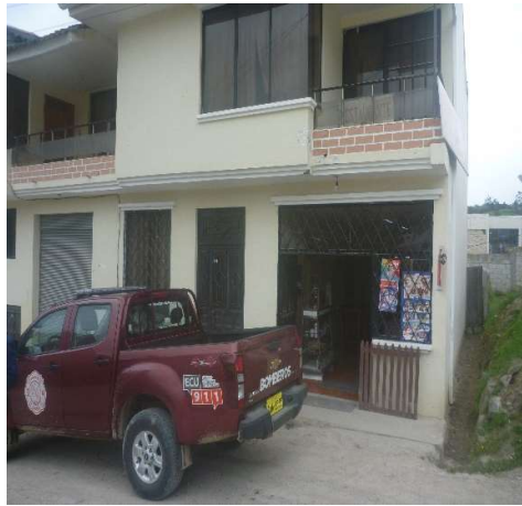
RESTAURANTE JIMA CENTRO