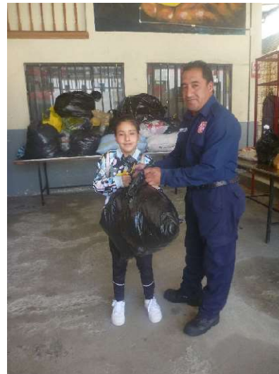
AYUDA PARA DANNIFICADOS