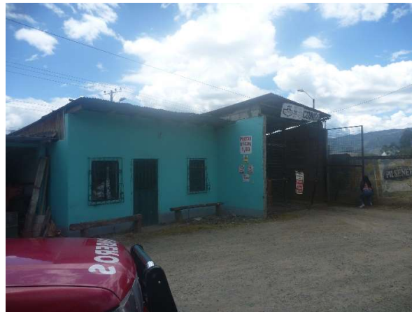
BODEGA GLP PIBLIA