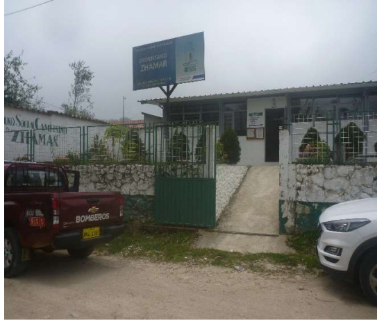
CENTRO DE SALUD ZHAMAR - JIMA