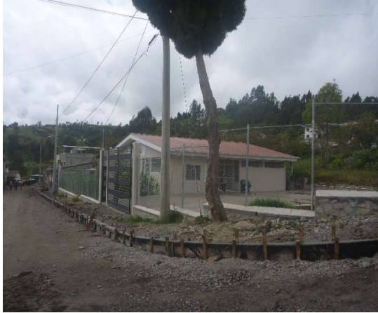
CENTRO DE SALUD JIMA CENTRO