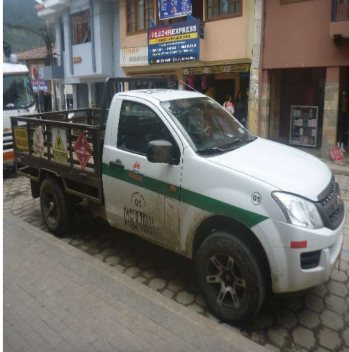
VEHICULO GLP SAN BARTOLOME