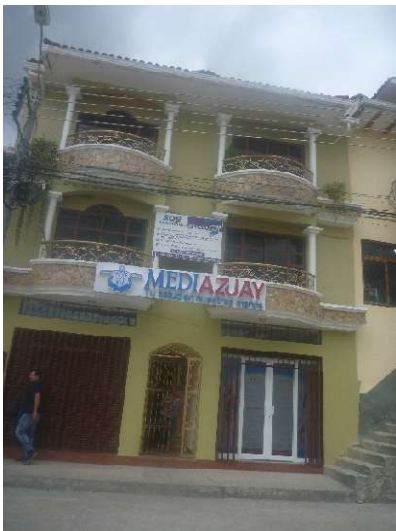
FARMACIA SIGSIG CENTRO