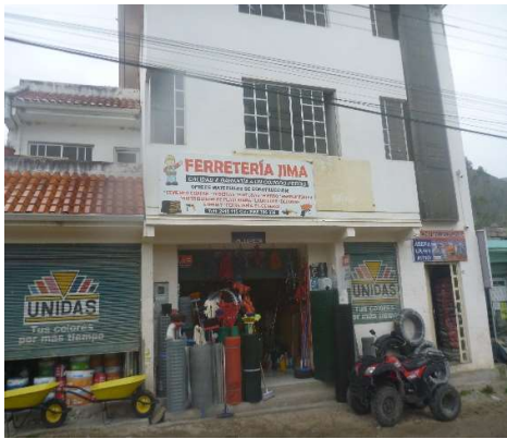
FERRETERIA JIMA CENTRO