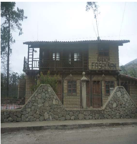
RADIO FASAYÑAN – SIGSIG