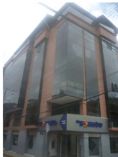
EDIFICIO PACHECO SIGSIG CENTRO