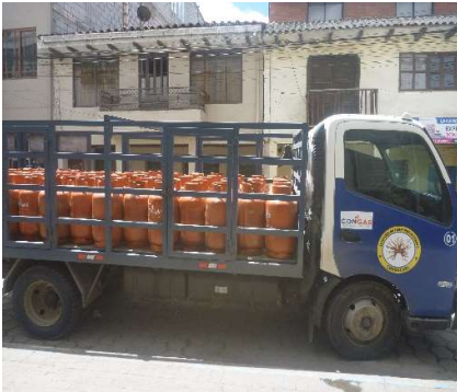
VEHICULO GLP -SIGSIG