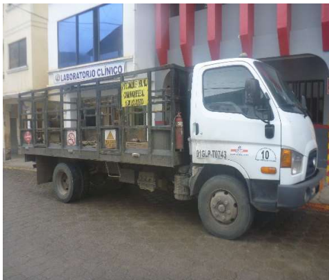
VEHICULO GLP SAN BARTOLOME